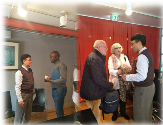
▲ 發表後與肯亞、澳大利亞與加拿大學者對談