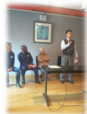
▲ 接受現場提問與回應