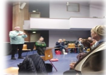
▲ 於法蘭克福 Schultheater-Studio 由各場主席針對宣言帶領分組討論