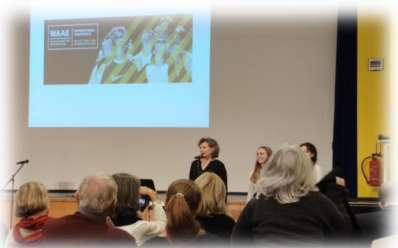
▲ WAAE 研討會開幕式

從 10 月 29 日到 11 月 1 日為止, 基本上分三個場地以三大主題: 「藝術教育對社會的功能」、「藝術教育對教育改革的影響與衝擊」, 以及「藝術教育的延展」進行論文發表。每一場次基本上各有來自四個不同國家的論文。為強化在地藝術教育脈絡, 在場與場之間, 主要是利用中午用餐和下午的休息時間分若干組到附近的博物館、學校等文化或教學機構進行參觀或工作坊。為增進與會者彼此交流的機會, 主辦單位用心安排小點心或晚餐。例如, 我在現場結交一位奧地利的老師, 她說 2020 年已確定 WAAE 將至美國舉辦, 她希望爭取後年至奧地利舉辦, 並且邀請我前來參加。若不是受到 Covid-19 疫情影響, 今年十月 WAAE 的活動必定接續舉行。