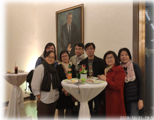
▲ 華人學者參與研討會