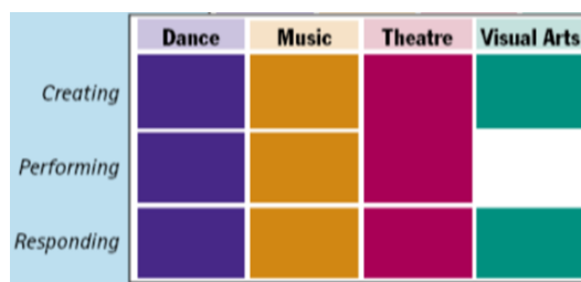
圖 1 美國國家教育進展評量 1997 藝術領域各學門評量架構

由上述可知，同樣倚賴感官，同樣涉及創作、表演實作與回應等面向，但舞蹈、音樂、戲劇、視覺藝術學門各有獨特性，加添藝術教育研究本質上之挑戰。