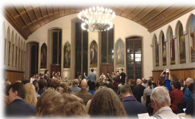
▲ 於法蘭克福市政廳舉辦的閉幕活動